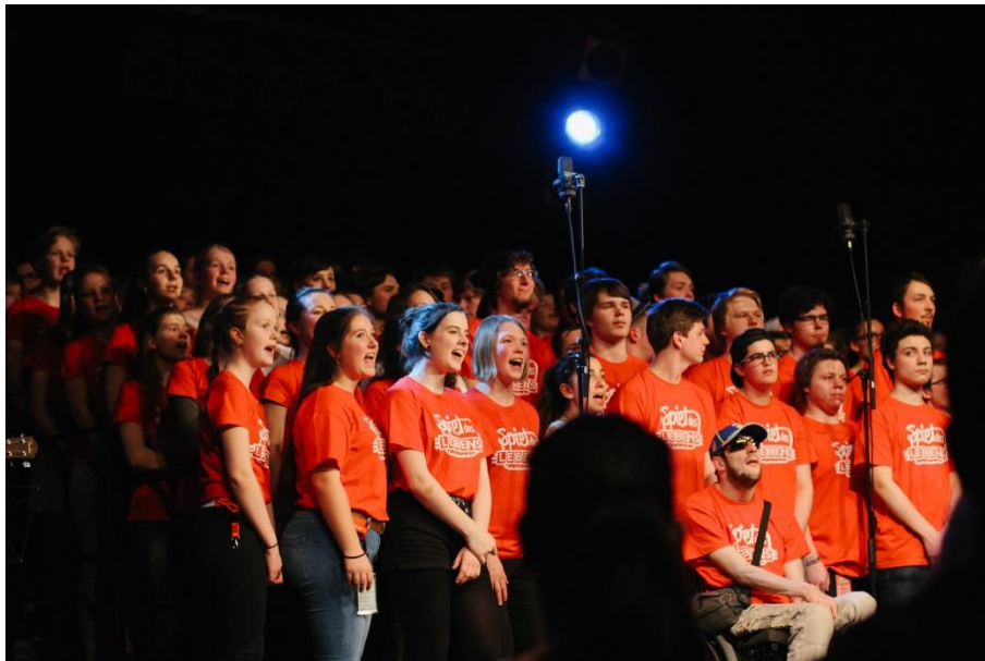
TEN SING plus „Spiel des Lebens“ Abschlussshow

Referat TEN SING (0561) 3087-255 tensing@cvjm.de 22.12.16